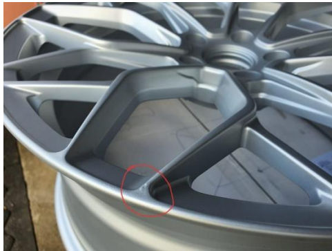
Defect ( eg. Paint Problem )

Please include those pictures to your attachments in your E-Mail.